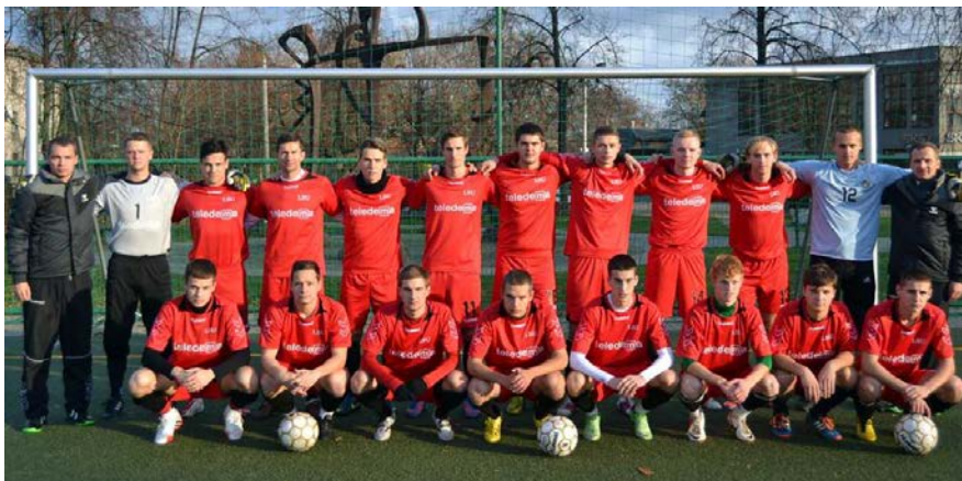
LSU futbolo komanda