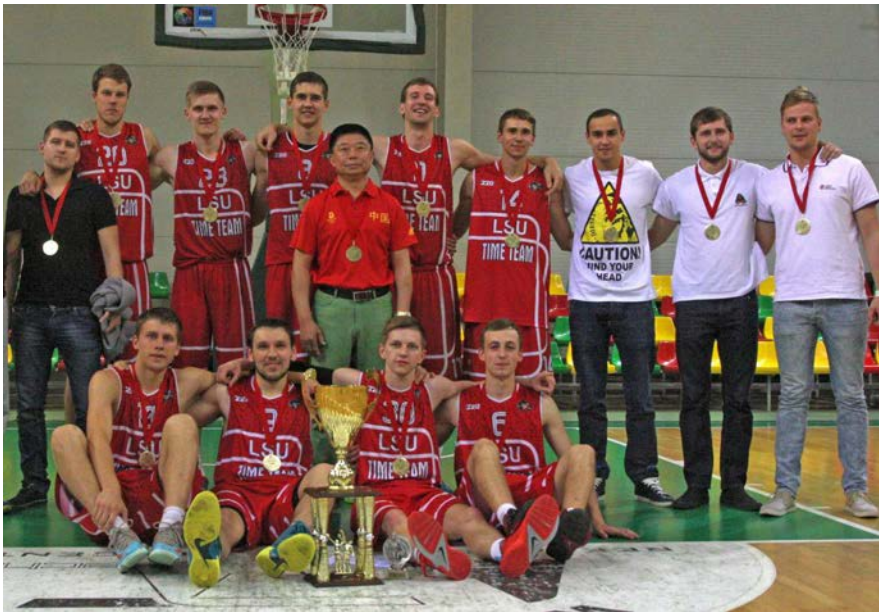
LSU trečioji vaikinų krepšinio komanda

Kauno krepšinio mėgėjų lygos Supertaurės varžybos – trečia vieta.