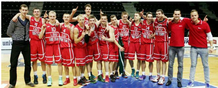
LSU antroji vaikinų krepšinio komanda