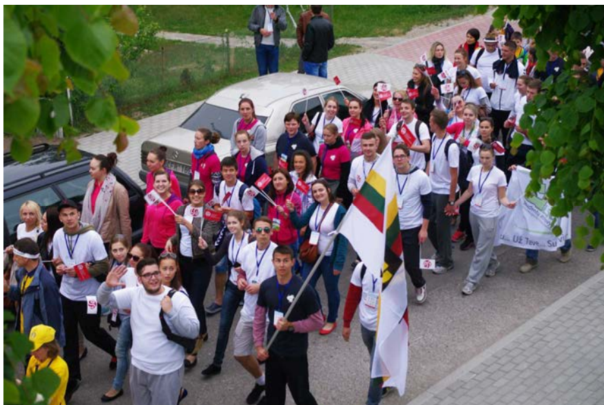
LSU studentų delegacija festivalio „Sportas visiems“ eitynėse