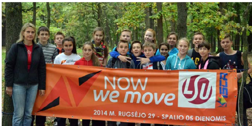
Krose dalyvavo Kauno „Vyturio“ katalikiškos vidurinės mokyklos moksleiviai