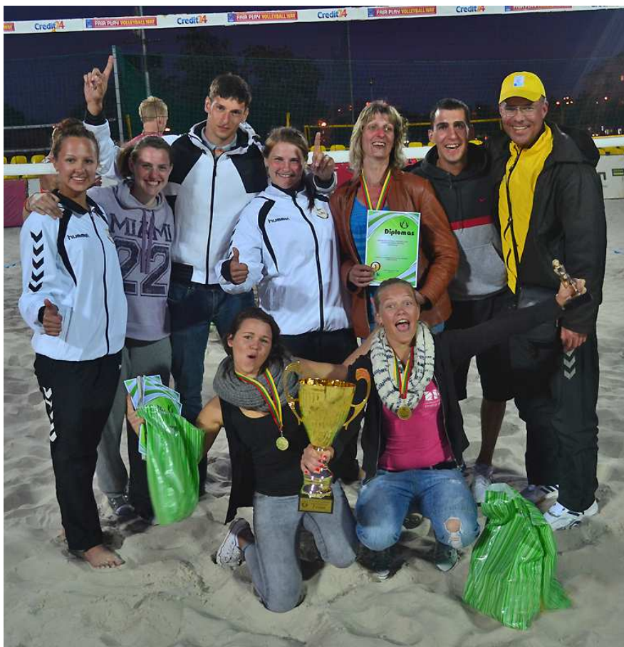
Paplūdimo tinklinio čempionate žaidusios LSU vaikinių ir merginų komandos