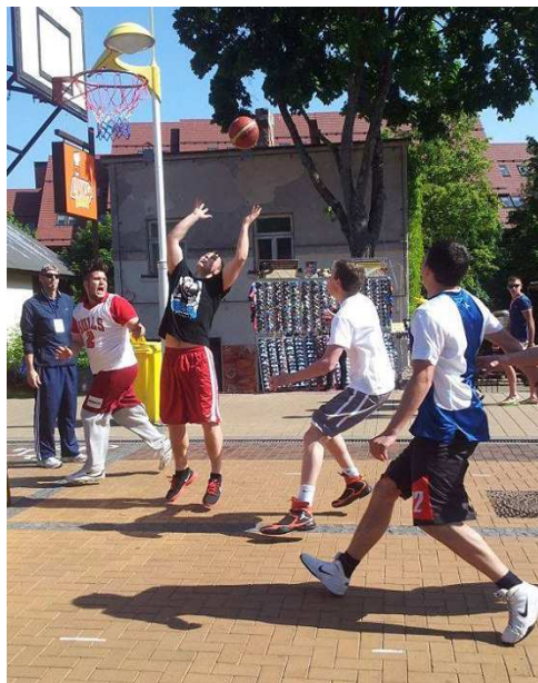
LSU komanda kovoja dėl pergalės krepšinio 3 × 3 turnyre