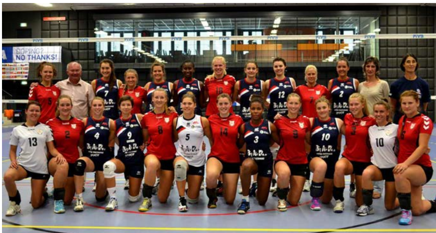
LSU ir Lotaringijos universiteto tinklininkių komandos

LSU merginų tinklinio komanda užėmė 10 vietą. Mūsų merginoms šios žaidynės nebuvo sėkmingos – jos laimėjo (3 : 0) tik vienas rungtynes prieš Tamperės universiteto (Suomija) studentes ir turėjo pripažinti kitų universitetų tinklininkių pranašumą. LSU studentės rezultatu 0 : 3 pralaimėjo Lotaringijos universiteto (Prancūzija) komandai, tokiu pat rezultatu – Groningeno universiteto (Nyderlandai) studentėms, rezultatu 2 : 3 – Tamperės universiteto (Suomija) rinktinei ir 3 : 1 – Rusijos valstybinio humanitarinio universiteto tinklininkėms.