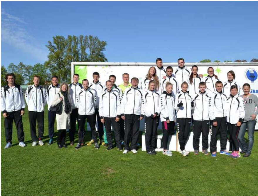
LSU lengvaatlečių rinktinė XXX SELL studentų sporto žaidynėse