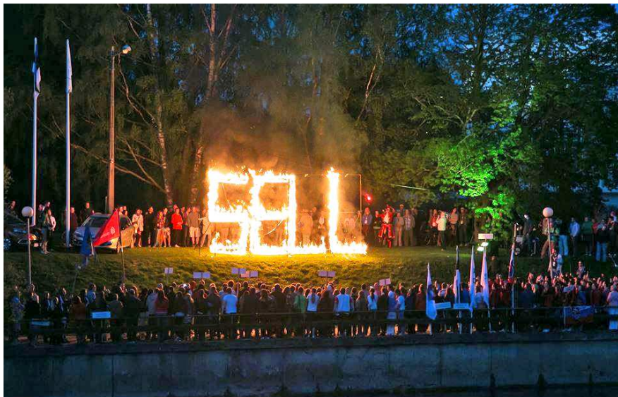
Akimirka iš XXX SELL studentų sporto žaidynių atidarymo

Iš viso žaidynėse Estijoje dalyvavo 1669 sportininkai iš 60 aukštųjų mokyklų, startavo net 12-os valstybių – Baltijos šalių, Belgijos, Gruzijos, Kinijos, Rusijos, Suomijos, Slovakijos, Švedijos ir Vokietijos – studentai. Lietuvos universitetams atstovavo net 401 sportininkas, didesnė buvo tik Estijos delegacija – ją sudarė 508 atletai. Septynių sporto šakų (plaukimo, lengvosios atletikos, orientavimosi, dziudo, jėgos trikovės, krepšinio ir tinklinio) rungtyse LSU atstovavo 67 studentai.