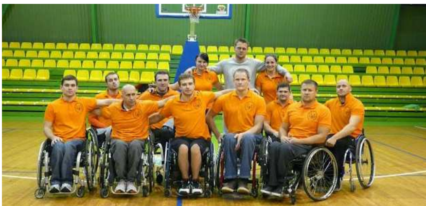
„LSU-RSK“ vežimėlių krepšinio komanda – sidabro medalių laimėtoja