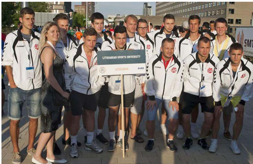
LSU salės futbolo komanda per II Europos universitetų sporto žaidynių atidarymą