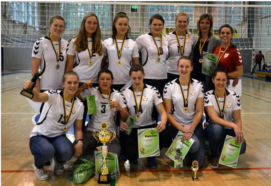
LSU merginų tinklinio komanda