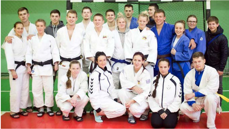
LSU dziudo rinktinė