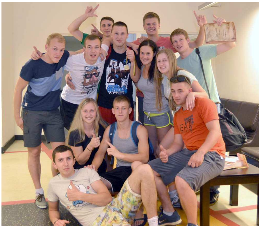
2013–2014 m. sportiščiausia LSU studentų grupė (KKU 12-2)