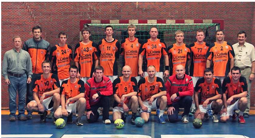
„LSU-Lūšies“ vyrų rankinio komanda

Rankinio turnyras „Kauno mero taurė“ – antra vieta.