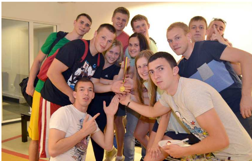
Komandinėje įskaitoje pirmą vietą užėmė KKU 12-2 grupės plaukikai