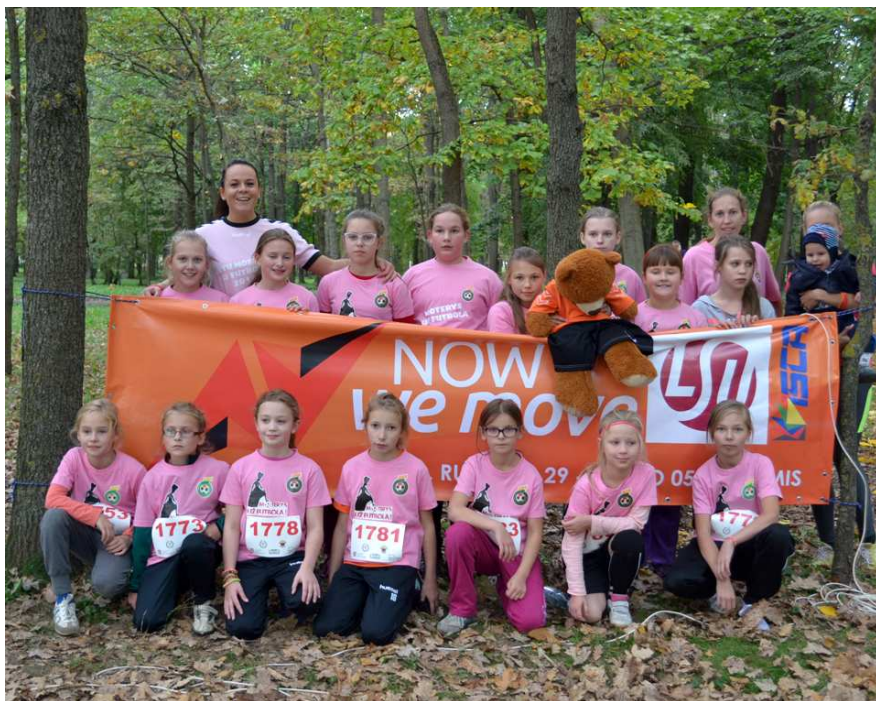
Aktyvios kroso dalyvės – mažosios Kauno FK „Kibirkštelė“ sportininkės