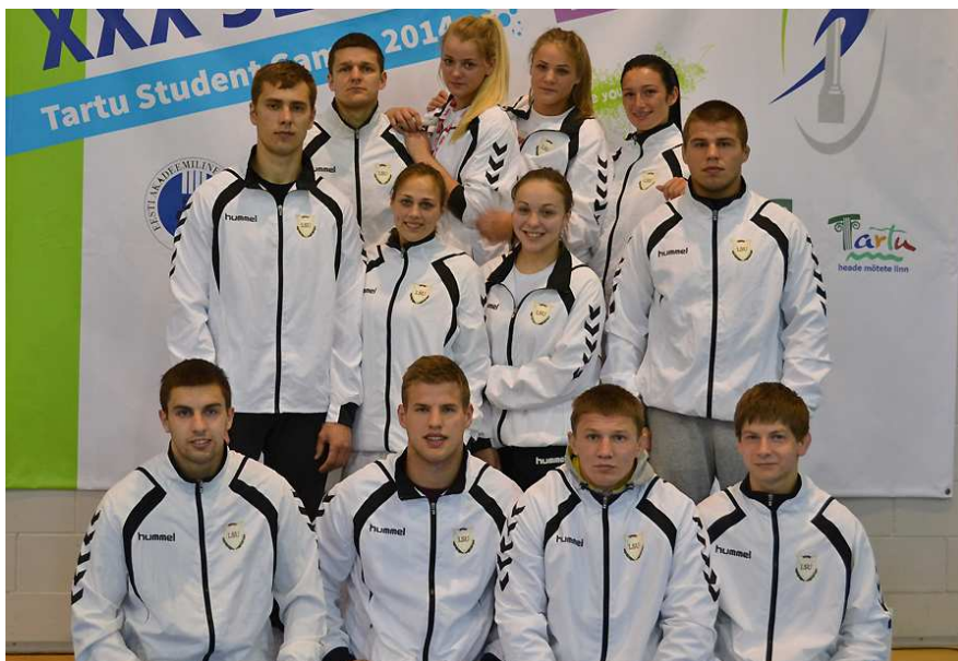
LSU dziudo rinktinė buvo kietas riešutėlis savo varžovams