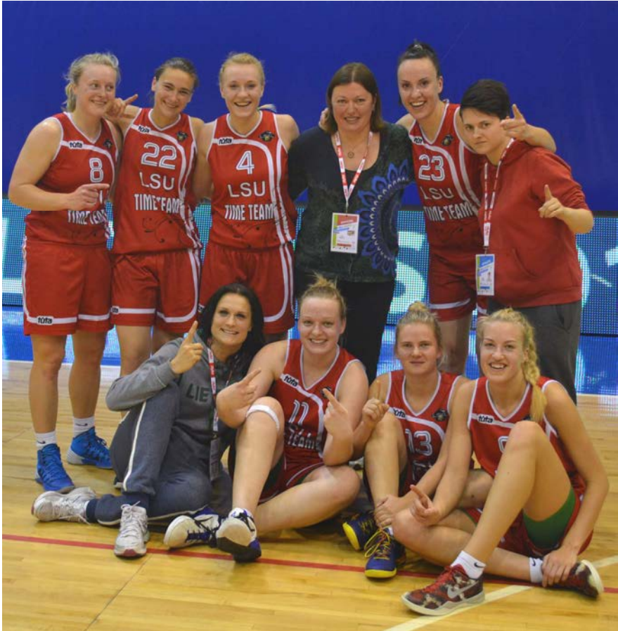
LSU krepšininės – XXX SELL studentų sporto žaidynių čempionės