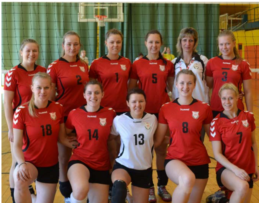
LSU tinklininkės XXX SELL studentų sporto žaidynėse