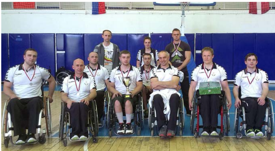
„LSU-RSK“ vežimėlių krepšinio komanda