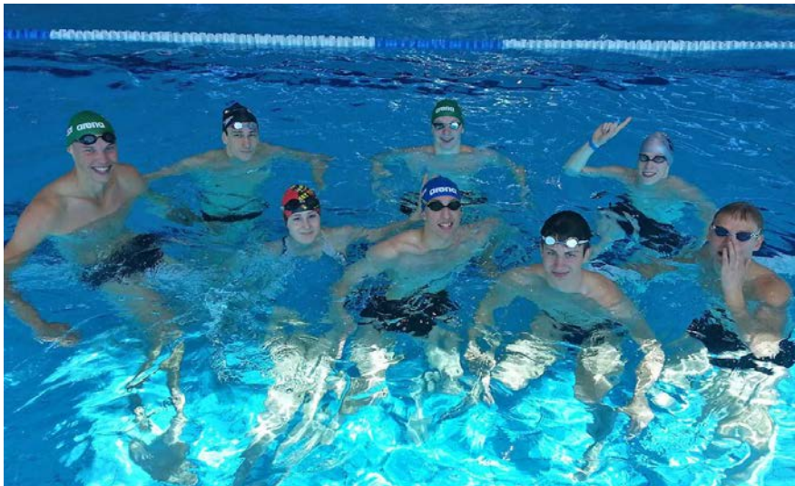
LSU plaukimo rinktinė, XXX SELL žaidynėse iškovojusi net 13 medalių