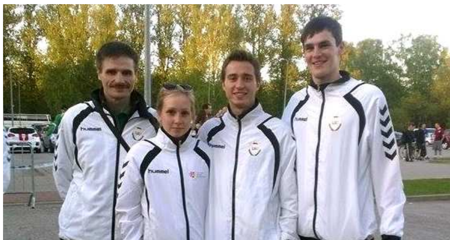
LSU orientacininkai – žaidynių aukso ir bronzos medalių laimėtojai

XXX SELL žaidynėms buvo gerai pasirengusi ir LSU orientacininkų komanda, namo parsivežusi du – vieną aukso ir vieną bronzos – medalius. Orienteerininkų rinktinės treneris P. Mockus.