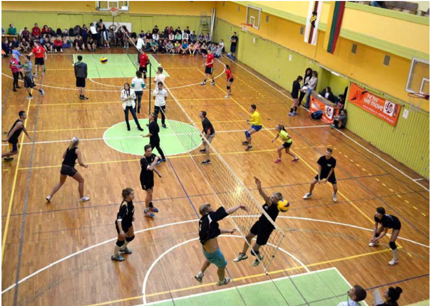
Tinklinio 3 × 3 turnyre vienu metu varžėsi net šešios komandos

Studentų grupėje rungėsi net 32 komandos. Nugalėtojų medalius iškovojo LSU Erasmus studentų komanda „SeDiKa“, sidabru pasipuošė KKKU 12-2 grupės komanda „Be kamuolio“, o bronza atiteko KKKU 13-1 komandai „Žemaitukai“.