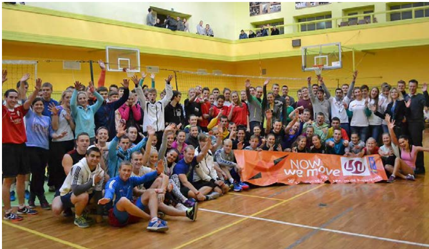
Projektas „Judėk kartu su LSU ‘14“ pritraukė rekordinį dalyvių skaičių

LSU, prisijungdamas prie akcijos, vykdė projektą „Judėk kartu su LSU ‘14“ skleidamas žinią, kad judėti yra smagu, o judėti kartu – dar smagiau. Šiais metais Sporto ir laisvalaikio centro surengtos atviros rudens kroso pirmenybės, orientavimosi sporto varžybos, mišraus trejeto tinklinio turnyras ir kiti renginiai sulaukė beveik 600 dalyvių iš 45 Kauno miesto ir rajono švietimo įstaigų. Visi galėjo atsigaivinti didžiausios gaiviųjų gėrimų gamintojos pasaulyje „Coca-Cola“ dovanotu „Bonaqua“ mineraliniu vandeniu, pasipuosti Judėjimo savaitės apyrankėmis. Nugalėtojai ir prizininkai buvo apdovanoti LSU marškinėliais, medaliais bei „Cappy“ sultimis.