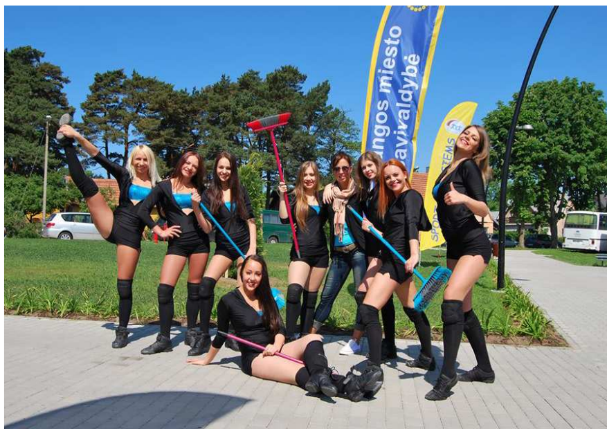
LSU „Chillidance“ šokėjos