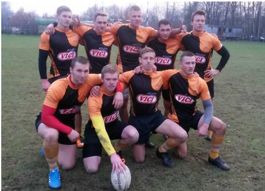
LSU regbio-7 komanda

Pirmojo Lietuvos universitetų regbio-7 čempionato I ture startavo Lietuvos sporto universiteto, Vadybos ir ekonomikos universiteto, Vilniaus Gedimino technikos universiteto, Mykolo Romerio universiteto, Lietuvos edukologijos universiteto, Šiaulių universiteto ir Kauno technologijos universiteto komandos.