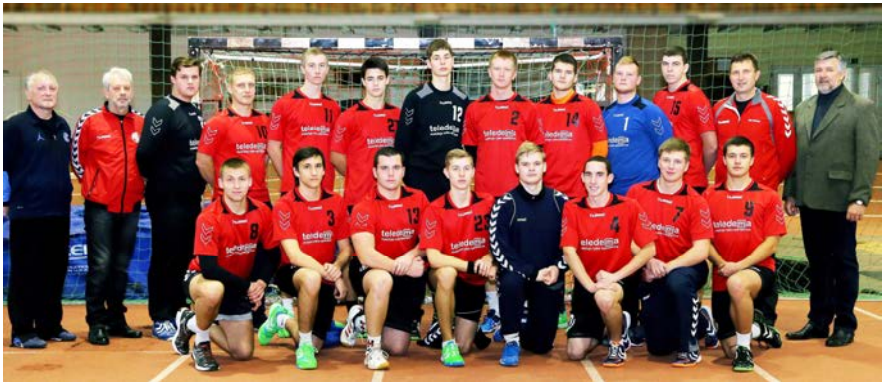
„LSU-Atleto“ vyrų rankinio komanda