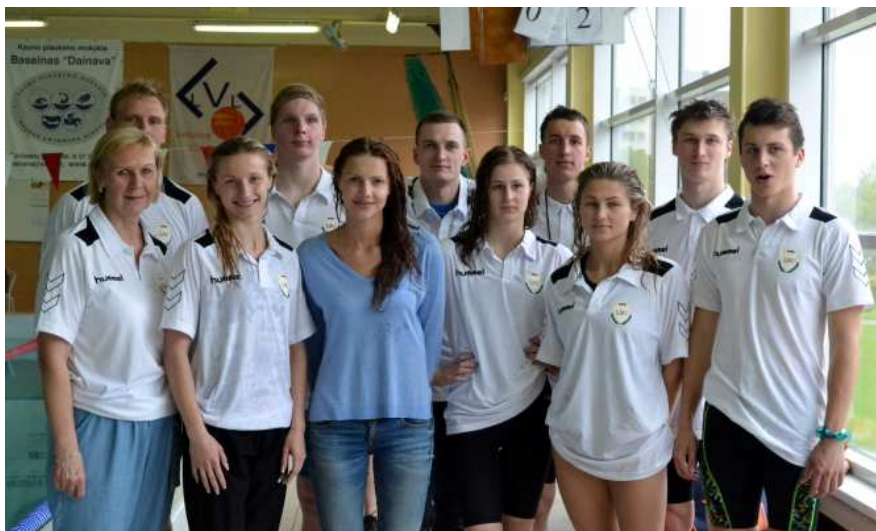
LSU plaukikų komanda