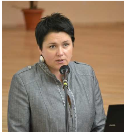
Konferencijos dalyvius sveikina LTOK prezidentė, olimpinė čempionė D. Gudžinevičiūtė