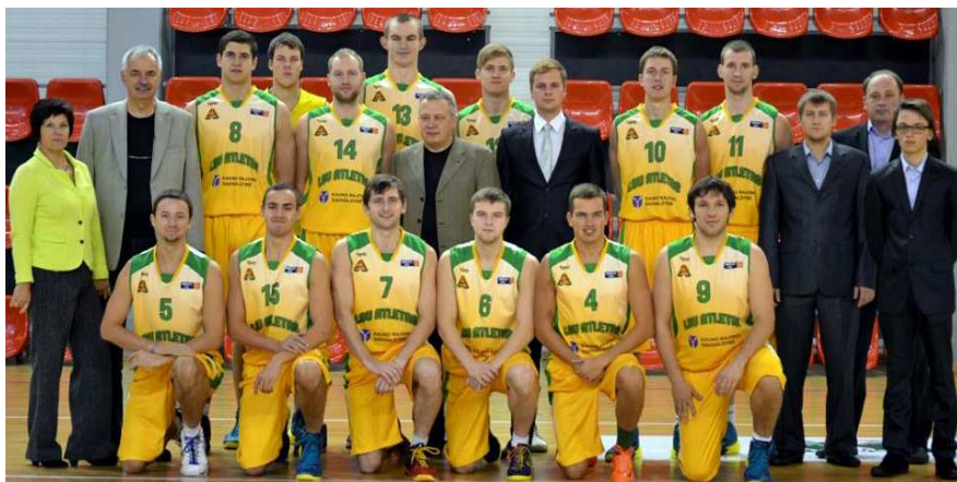
LSU pirmoji vaikinų krepšinio komanda