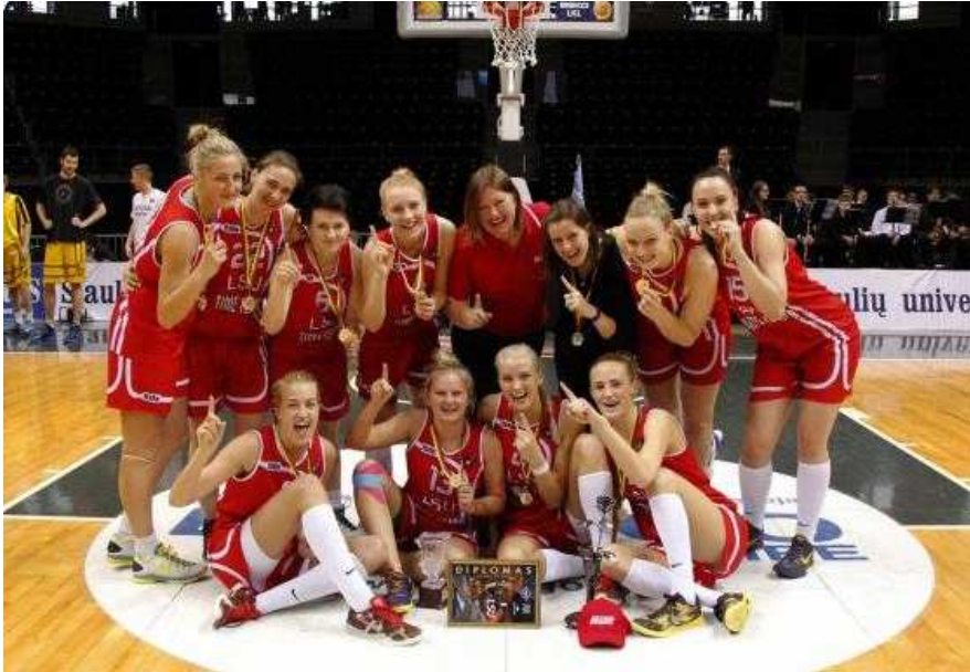
LSU merginų krepšinio komanda

SELL studentų sporto žaidynės – aukso medaliai.