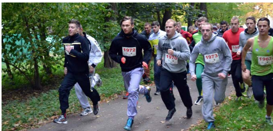
Ąžuolyne rudens krosą bėga studentai