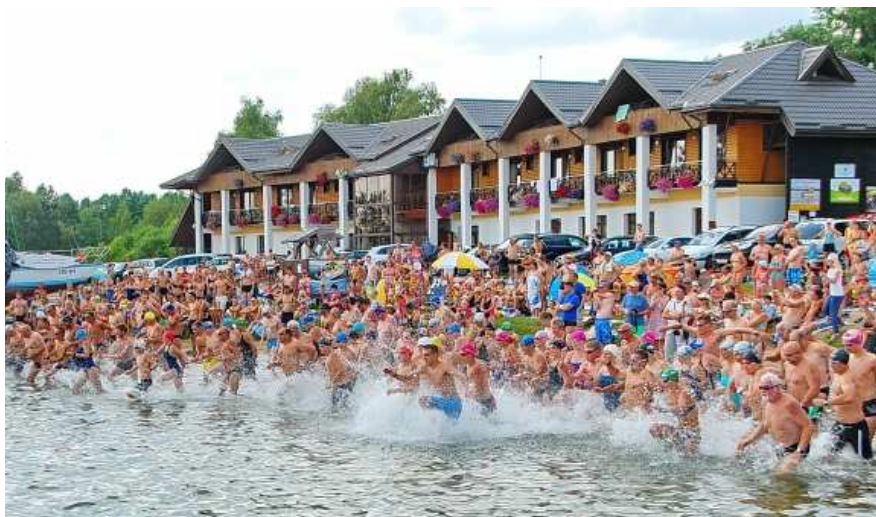
Startuoja plaukimo maratono dalyviai