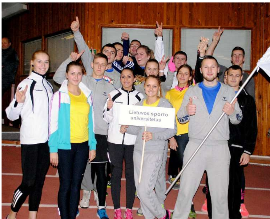
LSU studentai Lietuvos studentų olimpinio festivalio atidarymo metu

Olimpiniame festivalyje mūsų studentai iškovojo aštuonis medalius, o komandinėje įskaitoje užėmė antrą vietą.