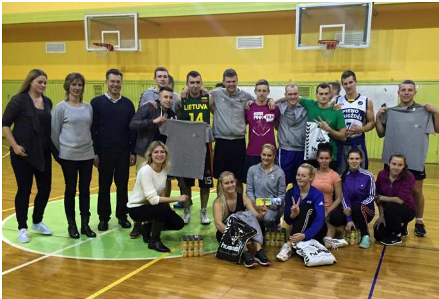
Turnyro „Tinklinis su krepšinio kamuoliu“ nugalėtojai, prizinininkai ir organizatoriai