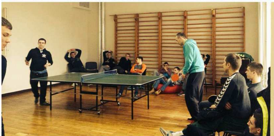
LSU studentų dvikova „Stalamūšio“ turnyre