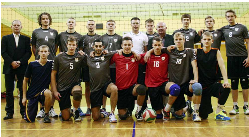
LSU vaikinių tinklinio komanda